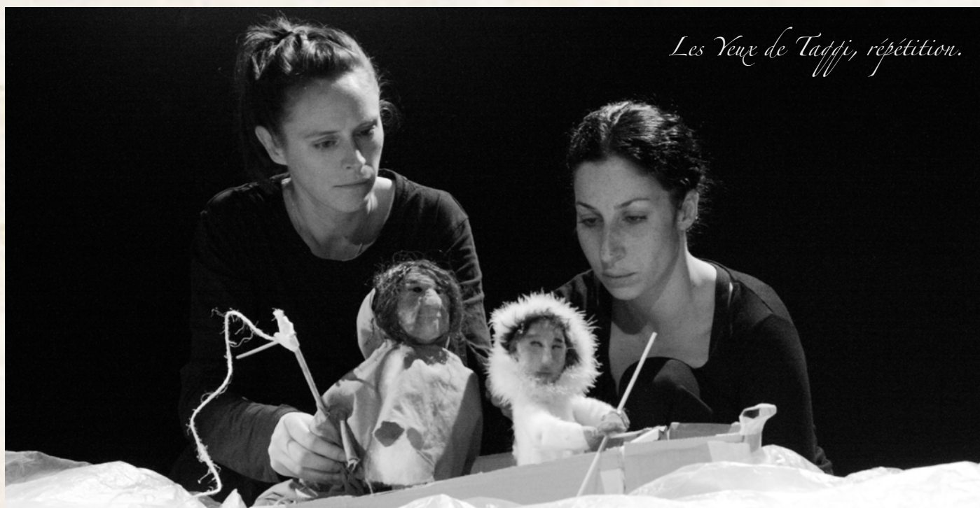
Les Yeux de Taqqi, répétition.

dans la catégorie « meilleur spectacle jeune public ».